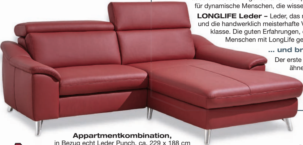
Appartmentskombination, in Bezug echt Leder Punch, ca. 229 x 188 cm

Alles eine Frage der richtigen Kombination. Auf kleinstem Raum ist hier eine Ottomane mit einem geräumigen Bettkasten untergebracht . Mit einer Stellfläche von ca. 229 x 188 cm ist die Gruppe auch für kleinste Räume geeignet.