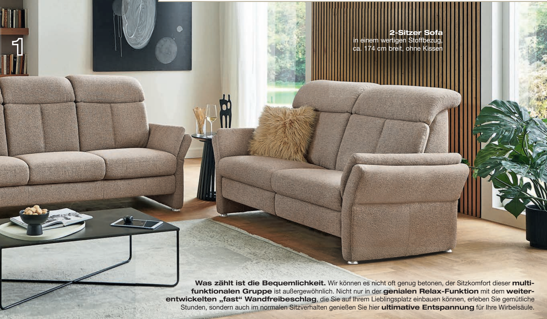
2-Sitzer Sofa in einem wertigen Stoffbezug, ca. 174 cm breit, ohne Kissen

Was zählt ist die Bequemlichkeit . Wir können es nicht oft genug betonen, der Sitzkomfort dieser multi-funktionalen Gruppe ist außergewöhnlich. Nicht nur in der genialen Relax-Funktion mit dem weiterentwickelten „fast“ Wandfreibeschlag , die Sie auf Ihrem Lieblingsplatz einbauen können, erleben Sie gemütliche Stunden, sondern auch im normalen Sitzverhalten genießen Sie hier ultimative Entspannung für Ihre Wirbelsäule.